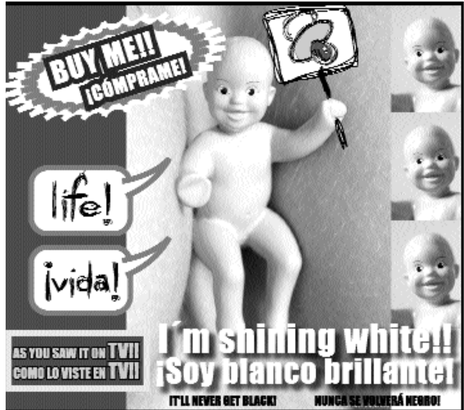
Artwork contributed by / Colaboración artística de Oscar Fernando Contreras Ibáñez

at least smile. Quietly I say to the women, "I don't know what stops any of these mad, well-fed, civilized people from adopting if they're so concerned about the well-being of unwanted children." Both women laugh, one louder than the other. The one who laughs less says, "Yeah. White babies. That's what it's all about." @